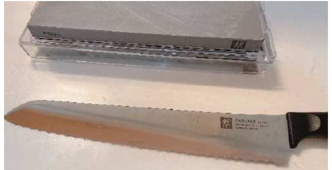
パン専用包丁と裏表番手が違う便利な砥石

今やこのタイプは世界的なデフォルトとなった感が強いが、実はその源流は日本の老舗の包丁メーカーが生き残りをかけて開発した努力と知恵の結晶だったという事を今回は強調させていただきたかった。