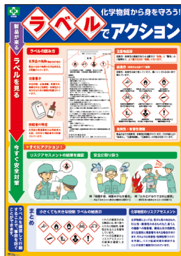
化学物質・ラベル No.31600