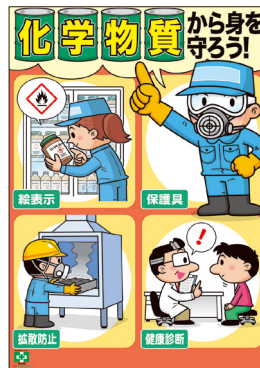
化学物質・身を守ろう No.31864