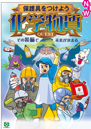
化学物質・保護具つける No.31931