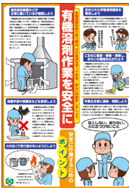
有機溶剤作業の安全 No.31582