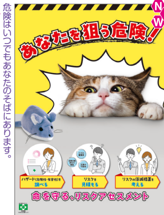
狙う危険・リスク No.31930