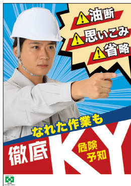
徹底 KY・危険予知 ※在庫限り No.31866