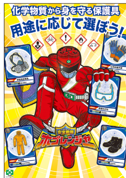
化学物質・保護具 No.31898