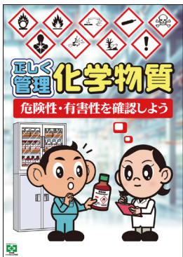
化学物質・正しく管理 No.31923