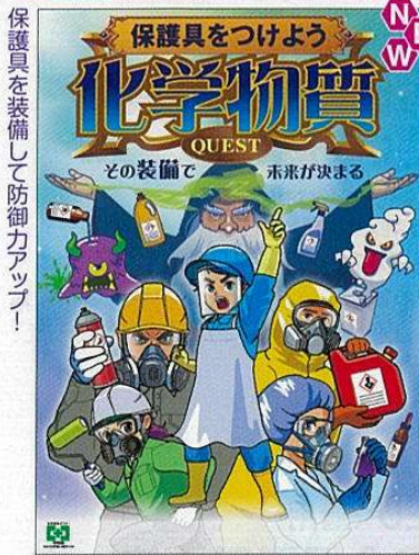
化学物質・保護具つける No.31931