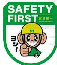
セーフティワッペン (ヨシだ君) No.44073 定価 825円