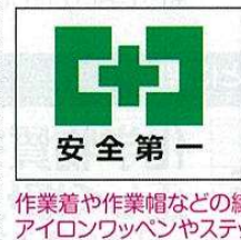
安全衛生マーク 2WAY ワッペン No.44090 定価 1,870円 5枚入

●サイズ: H37.5×W50mm ●材質: ポリエステル ※2WAY: アイロンワッペン・ステッカー両用タイプ