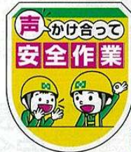
声かけ・安全作業ワッペン No.44085 定価 825円

●サイズ: H83×W50mm ●材質: ビニール ●ピン付/透明ポケット付/中紙挿入式/中紙 (H40×W15mm) 付