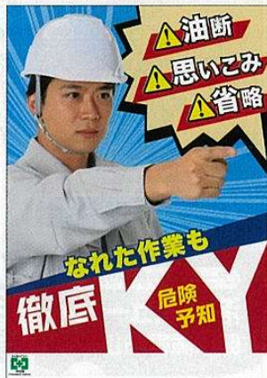
徹底 KY・危険予知 ※在庫限り No.31866