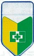
新入者ワッペン No.44056 定価 275円

●サイズ: H83×W50mm ●材質: ビニール ●ピン付/透明ポケット付/中紙挿入式/中紙 (H40×W15mm) 付