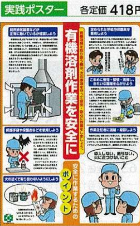
有機溶剤作業の安全 No.31582