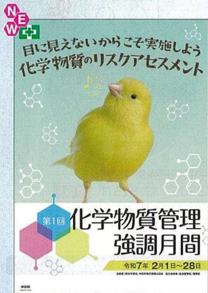
スローガン C No.31354