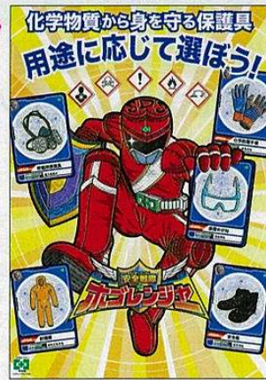
化学物質・保護具 No.31898