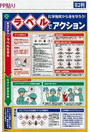
化学物質・ラベル No.31600