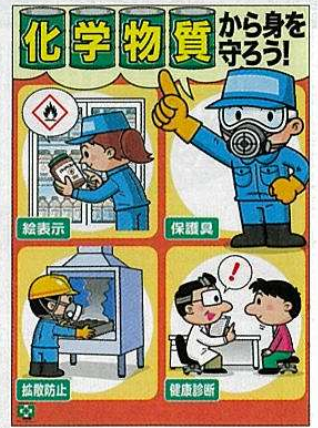
化学物質・身を守ろう No.31864