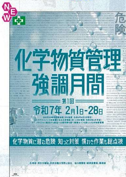
スローガン D No.31356