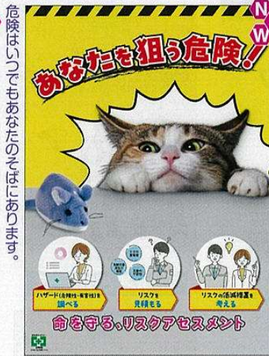
狙う危険・リスク No.31930