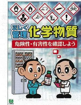
化学物質・正しく管理 No.31923