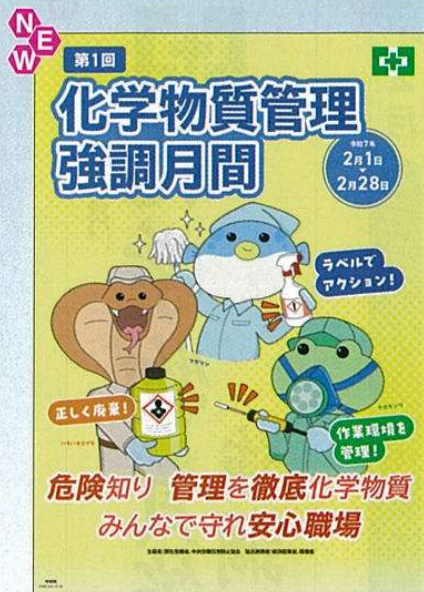
スローガン B No.31352