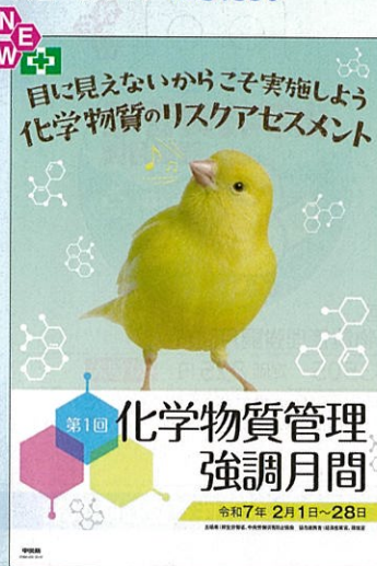
スローガン C No.31354