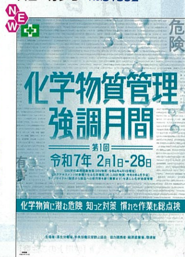
スローガン D No.31356