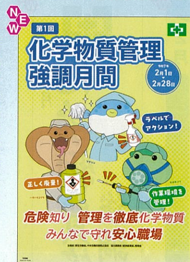
スローガン B No.31352