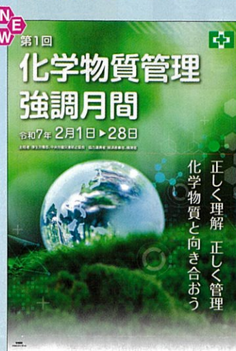
スローガン A No.31350

キャンペーンポスター 各定価 319 円 B2判 ※デジタル版対応(価格:1口 3,850 円)