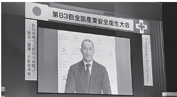
▲室伏スポーツ庁長官祝辞