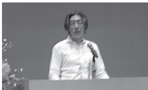
▲主催者代表挨拶 (杉本支部長)