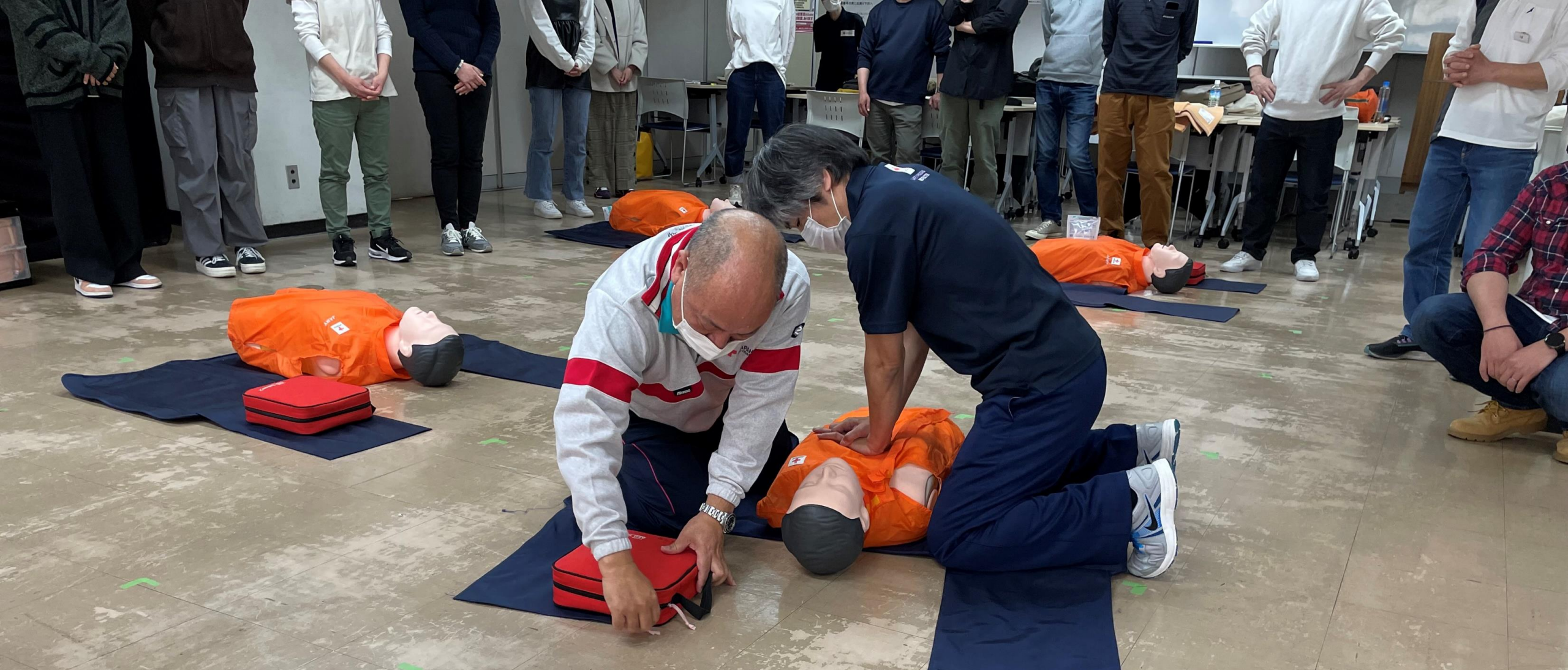
2024年4月10日(水) 救急法講習(基礎+短期)