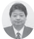
（公）神奈川労務安全衛生協会 横須賀支部

新年あけましておめでとうございます。横須賀支部及び会員の皆様にご挨拶申し上げます。日頃から労働基準行政にご理解ご協力を賜り、厚く御礼申し上げます。さて、県内の経済情勢は平成二十七年一月の金融経済概況によれば、「緩やかに回復している」とされ、堅調に推移しているものの、一方で多くの業種で人手不足が続いています。過重労働による健康障害防止は労働基準行政の最重要課題であり、本年も監督指導等の取組により労働関係法令の履行確保を図るとともに、長時間労働の抑制や年次有