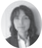
横須賀労働基準監督署